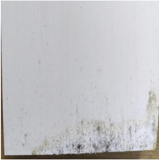
通常の膠 カビが繁殖