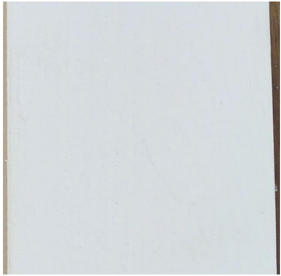
耐水性膠 カビは繁殖していない